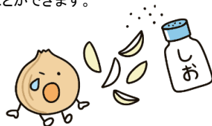
切った時に涙が出る場合は、塩をひとふり！

たまねぎに塩をふると、浸透圧によって辛味成分が外に出て食べやすくなります。たまねぎは加熱により甘くなりますが、加熱してもやわらかくなりやすく、辛味が残ってしまうものもあります。そのようなたまねぎの場合は、塩を活用しましょう。